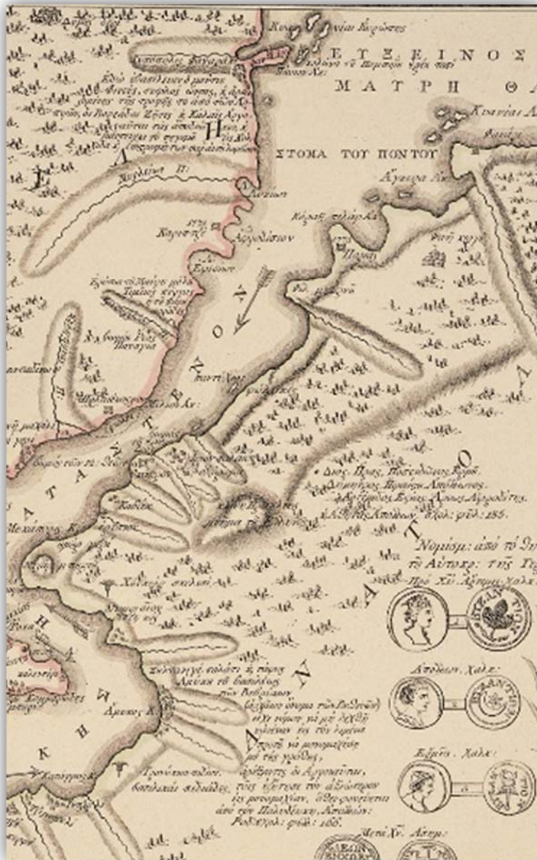
Λεπτομέρεια από την «Επιπεδογραφία της Κωνσταντινουπόλεως» με τις αναγραφές της χρονολογίας «1773» και των κειμένων για την Αργοναυτική εκστρατεία.