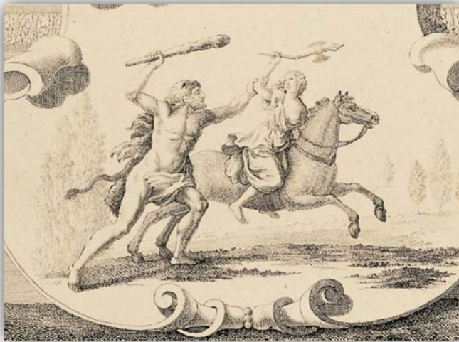
Ο Ηρακλής με το ρόπαλο, σύμβολο της ελληνικής δύναμης, στην πάλη με την Αμαζόνα που κρατάει το αμφίστομο τσεκούρι σύμβολό της περσική-ασιατικής δύναμης.