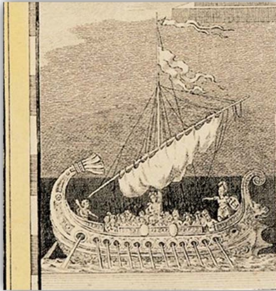
Η Αργώ στην σελίδα τίτλου της Χάρτας της Ελλάδος , Βιέννη 1797.