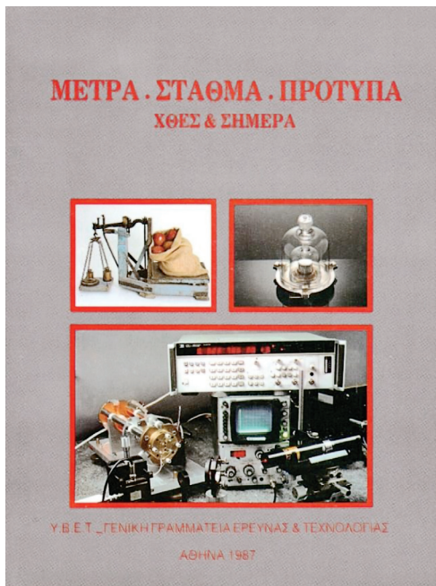
Σελίδα τίτλου του εντύπου «Μέτρα-Σταθμά-Πρότυπα. Χθες και σήμερα» της Γενικής Γραμματείας Έρευνας και Τεχνολογίας, Αθήνα 1987.