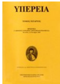
Ο τέταρτος τόμος ΥΠΕΡΕΙΑ με τα Πρακτικά του Δ΄ Διεθνούς Συνεδρίου «Φεραί-Βελεστίνο-Ρήγας», 2006.