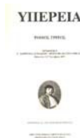
Ο τρίτος τόμος ΥΠΕΡΕΙΑ με τα Πρακτικά του Γ΄ Διεθνούς Συνεδρίου «Φεραί-Βελεστίνο-Ρήγας», 2002.