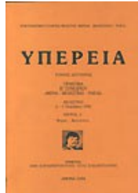
Ο πρώτος τόμος ΥΠΕΡΕΙΑ με τα Πρακτικά του Α΄ Διεθνούς Συνεδρίου «Φεραί-Βελεστίνο-Ρήγας, 1990.

Χρυσοστόμου Παύλος, Ασδεράκη-Τζουμερκιώτη Ελένη, Σταυρακούδη Καλλιόπη και Sprawski Slawomir, ενώ από μία ανακοίνωση είχαν οι υπόλοιποι 16 συγγραφείς. Επίσης σημειώνουμε ότι οι 27 από τις 33 εργασίες, που ανακοινώθηκαν στα Πέντε Διεθνή Συνέδρια, ήταν εργασίες με αντικείμενο τις ανασκαφικές έρευνες των Φερών, οι οποίες μάλιστα εκείνο καιρό κατά κανόνα ήταν σε εξέλιξη και ανακοινώνονταν τα πρώτα αποτελέσματα των ερευνών τους.