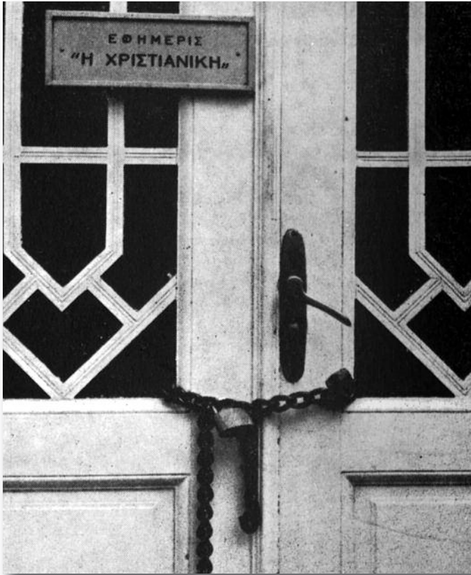
Η πόρτα της εφημερίδας «Χριστιανική» αλυσοδέθηκε το 1973 από την Δικτατορία.

λγνα Νάσερ", απαγόρευσε στα αμερικανικά βομβαρδιστικά να ανεφοδιαστούν στη Σούδα για να κατευθυνθούν στη Μέση Ανατολή προκαλώντας, ίσως εν αγνοία του, μια μείζονα και άμεση γεωπολιτική μετατόπιση της χώρας, την οποία ο ίδιος πλήρωσε με την πτώση του λίγες εβδομάδες αργότερα στο Πολυτεχνείο...», Γεώργιος Π. Μαλούχος, Η άνοδος και η πτώση της Γερμανικής Ευρώπης , εκδόσεις Πατάκη, β' έκδ. Αθήνα, Νοέμβριος 2012, σελ. 265.