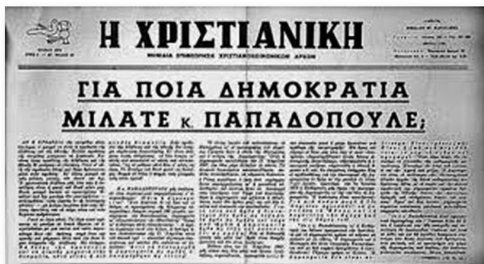
Το χαρακτηριστικό αντιστασιακό άρθρο του Νικ. Ψαρουδάκη κατά της Χούντας του δικτάτορα Γ. Παπαδόπουλου στην εφημερίδα "Χριστιανική", Ιούνιος 1973.

Με εκτίμηση Δρ. Δημήτριος Καραμπερόπουλος».