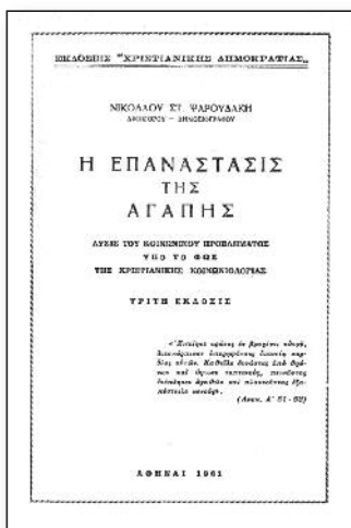
Η σελίδα τίτλου του σημαντικού διαφωτιστικού βιβλίου της Χ.Δ., «Η Επανάσταση της Αγάπης», τρίτη έκδοση 1961.

Στο βιβλίο αυτό της «Επανάστασης της Αγάπης», παιδιά μου, τα θέματα παρουσιάζονται μεθοδικά με λογική σειρά, σε γλώσσα στρωτή, κατανοητή και όλα τεκμηριωμένα με κείμενα της Αγίας Γραφής. Διαβάζεται εύκολα τόσο από τον μορφωμένο όσο και από τον ολιγογράμματο αναγνώστη. Στο Α' Κεφάλαιο γίνεται παρουσίαση του περιεχομένου και ανάλυση της Χριστιανικής Δημοκρατίας. Στο Β' Κεφάλαιο γίνεται αναφορά στο θέμα «Χριστιανισμός και πολιτική». Τονίζεται πως και η πολιτική περιλαμβάνεται στην καθολικότητα του Χριστιανισμού. Διεξοδικά αναλύεται και αργογραφικά τεκμηριώνεται το ζήτημα των εξουσιών. Στο Γ' Κεφάλαιο παρουσιάζονται τα δύο υλιστικά κοινωνικοπολιτικά συστήματα, της Κεφαλαιοκρατίας και του Κομμουνισμού. Γίνεται ανάλυση του περιεχομένου της Κεφαλαιοκρατίας ή Καπιταλισμού, που διακρίνεται σε τρία στάδια: α) Εμποροκρατία ή Μερκαντιλισμός, β) Φυσιοκρατία και γ) Ατομιστική ή Κλασσική Σχολή. Και των τριών