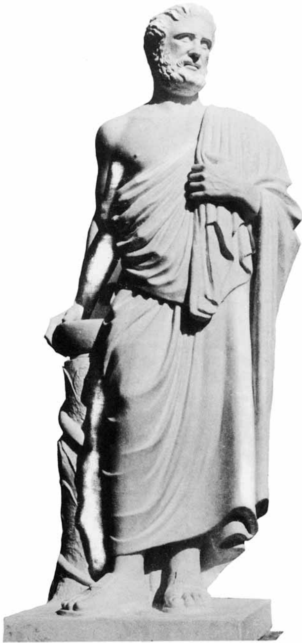
Ἱπποκράτης, ἔργο τοῦ γλύπτου Κωνστ. Ν. Γεωργακά