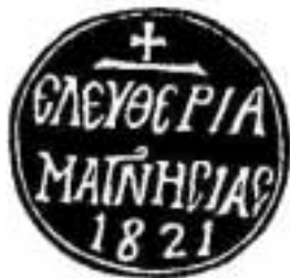
Η σφραγίδα της Επανάστασης της Μαγνησίας το 1821.

Κι ο Γαζής για να εμψυχώσει τους επαναστατημένους ραγιάδες και να τους ωθήσει στον τιτάνιο του πολέμου αγώνα, μοιράζει στους στρατιώ-