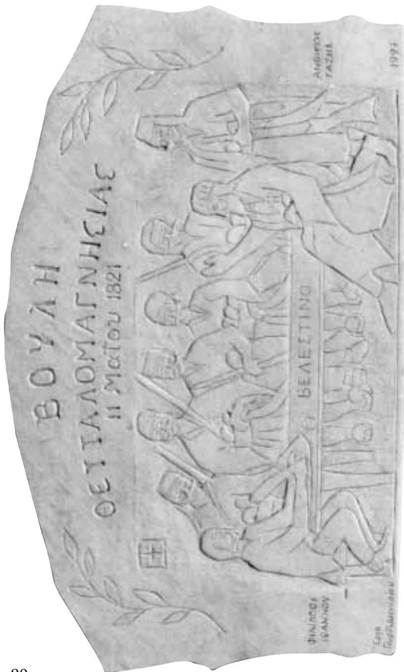
Το γλυπτό του Μνημείου της «Βουλής Θεσσαλοναγρηνσίας, 11 Μαΐου 1821», έργο του κ. Γεωργίου Διονυσίου