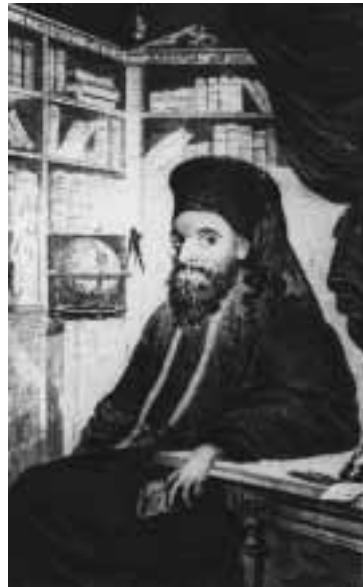
Άνθιμος Γαζής. (Εικόνα από το βιβλίο που μετέφρασε και εξέδωσε "Γραμματική των φιλοσοφικών επιστημών", Βιέννη 1799).

Μετά την έκρηξη της επανάστασης στην Πελοπόννησο και Στερεά Ελλάδα, δύο μήνες αργότερα, τον Μάιο του 1821, η επαναστατική φλόγα έφθανε και στην Μαγνησία. Αρκετοί κάτοικοι των χωριών του Πηλίου, που ήταν ήδη μυημένοι στη Φιλική Εταιρεία, καθώς και όλοι όσοι ήθελαν την αποτίναξη της πολύχρονης τυραννίας και την απόκτηση της πολυπόθητης ελευθερίας άρπαξαν τα όπλα, με πρωτοστάτη τον αρχιμανδρίτη Άνθιμο Γαζή.