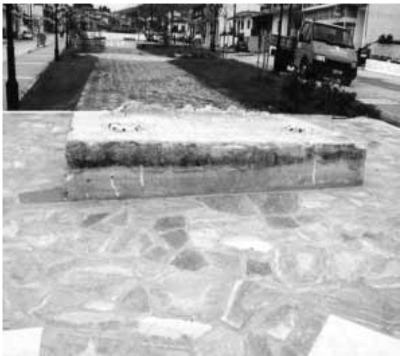
Κάποτε είχε στηθεί εδώ το Μνημείο «Βουλή Θετταλομαγνησίας»...

Οκτώ χρόνια έμεινε "όρθιο" το «Μνημείο της Βουλής Θετταλομαγνησίας», αλλά τελικά φαίνεται δεν ήταν αρεστό και κατά την διαμόρφωση του περιβάλλοντα χώρου το γκρέμισαν και του άφησαν μόνο κάτι απομεινάρια να χάσκουν στη βάση του, να δείχνουν την πρότερή του θέση. Όποιος θα είδε αυτήν την κατεδάφιση θα νόμιζε