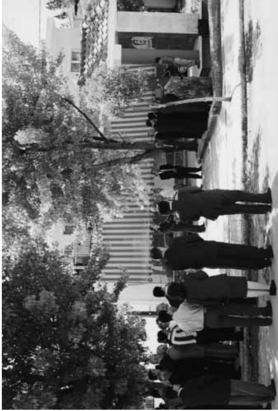
Μέρος του κόσμου που συμμετείχε στα αποκαλυπτήρια του Μνημείου την 21η Μαΐου 2000.