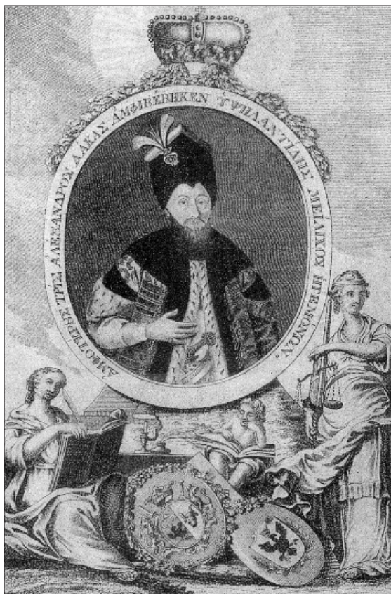
Τό ρόπαλο του Ήρακλέους κάτω άπό τούς θυρεούς στήν προσωπογραφία του ήγεμόνα τής Βλαχίας.

πού θέλει νά πεί ότι όταν οί σκλαβωμένοι λαοί του Βαλκανικού χώρου ξυπνήσουν μέ τόν επαναστατικό του Θούριο καί τήν επανάστασή του θά άρπάξουν τό ρόπαλο – τά άρματα – θά γκρεμίσουν τήν άπολυταρχική έξουσία του Σουλτάνου καί θά δημιουργήσουν τή «Νέα Πολιτική Διοίκηση», τή δημοκρατική πολιτεία. Ό Ρήγας παρόμοια καί στους χάρτες τής Βλαχίας καί τής Μολδαβίας 19 στίς παραστάσεις κάτω άπό τήν προσωπογραφία του ήγεμόνα έχει θέσει τό ρόπαλο του Ήρακλέους, πού γιά πρώτη φορά έχει έντοπισθει τώρα κατά τήν επανέκδοσή τους.